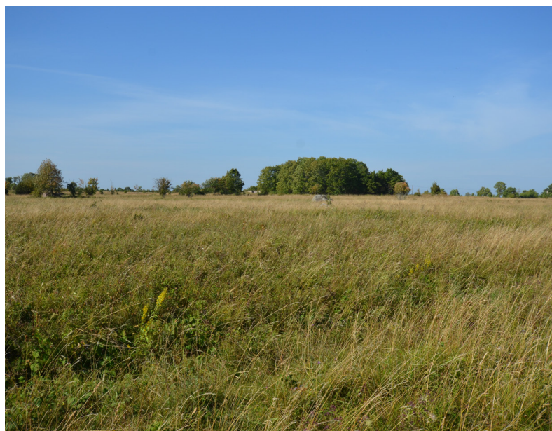
PILT 1. Saastna Kabelimägi tasasel Läänemaa maastikul.

HOONE VÄLIMUS JA SISUSTUS. Kabeli välismõõtmed olid 16 × 6 meetrit. Hoone põhjaseinast oli alles vaid ligi pooleteise meetri