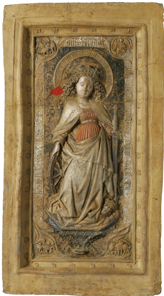
PILT 4. Püha Katariinat kujutav 15. sajandi teise poole keraamiline plaat Victoria & Alberti Muuseumis Londonis. Saastna kild on pildil märgitud punasega.