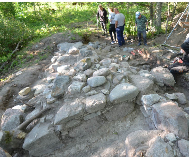
PILT 3. Tugipiilari jäänus kabeli lääneotsas.

laiendati. Nüüd paljandunud vundamendijäänustest ilmnes, et kabeli põhjaküljel on olnud väike umbes 3-ruutmeetiline kõrvalruum, võib-olla kõrvalkabel, kus jätkuvalt oli rohkesti münte. Sealt leitud rahade vanus näitab, et traditsioon samasse kohta ohverdada püsis veel kaua pärast hoone varemetesse jäämist.