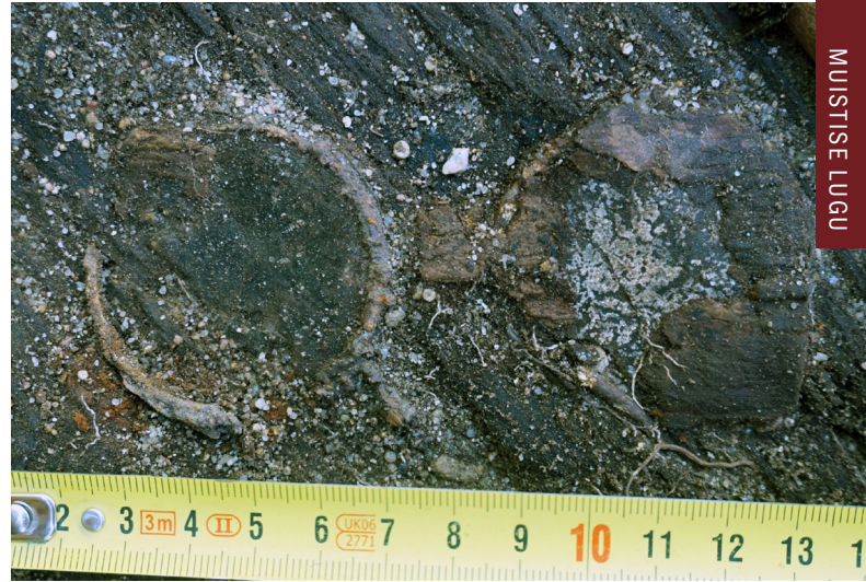
PILT 5. Näpitsprillid arvatavalt Põhjasõja aegse matuse juurest.

Veel üks meheluustik avastati kabeli idaosa sisemusest. Talle oli kaasa pandud rohkelt erinevaid esemeid, mis asusid jalgade all ja vahel. Ainulaadne leid Eesti kalmistute uurimisos on reieluude vahelt leitud ümarate klaasidega ja rauast raamiga